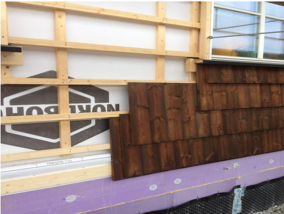
Veggspøn i Royal Brun. 2 lags tekking.

All spøn med unntak av veggspøn i Royal brun monteres med høvla side fram. Veggspøn i Royal Brun monteres med ru side fram. Det går 42 takspøn og 28 veggspøn per m 2 . av standard dimensjon.